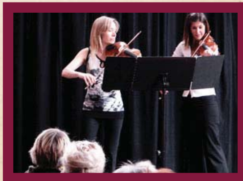
Série Muffins aux sons