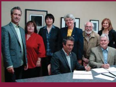
Ratification de l'entente collective