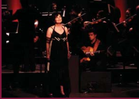
Une Saint-Valentin avec Dorothée Berryman