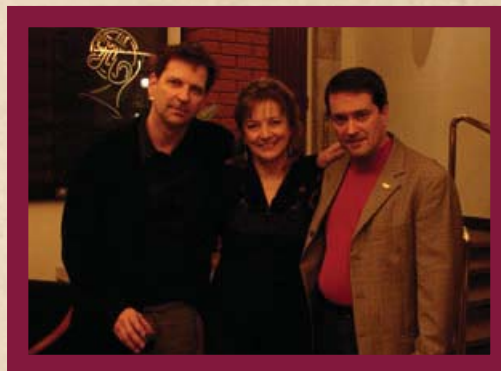
Ode à la beauté du monde