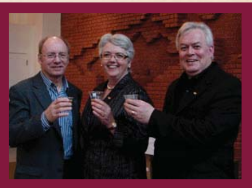
Dégustation de bières