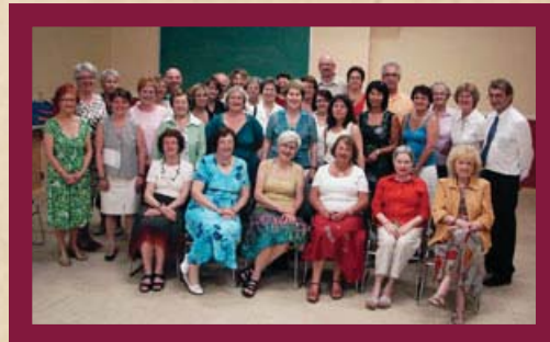
Amis de l'OSTR