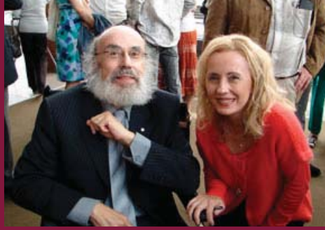
Hommage à Trois-Rivières