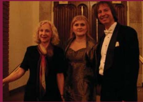
L'univers de Carmen