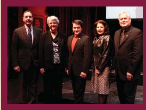
Lancement de la nouvelle saison